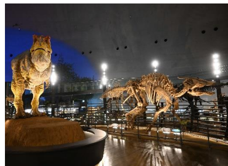
福井県立恐竜博物館