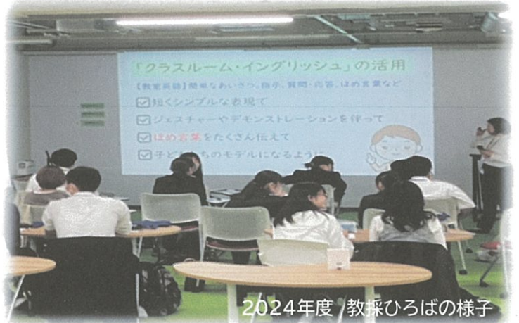
2024年度 教採ひろばの様子

ご参加希望の方は、 事前予約制 になって おりますので、ポスター・チラシまたは 右記に掲示されている「二次元コード」より ログインの上、お申込ください