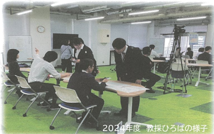
2024年度 教採ひろばの様子